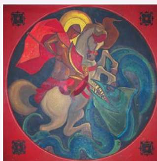
Н.К. Рерих. Свет побеждает тьму. 1933

Великая Семья России, как называют семью Рерихов, — это содружество выдающихся людей, объединённых высокой идеей служения благу человечества.