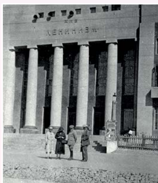
Е.И. Рерих и Н.К. Рерих в Новосибирске. 1926

Музей Н.К. Рериха в Новосибирске — один из десяти музеев на планете, посвящённых творчеству великого русского художника. Рерих придавал огромное значение Сибири, предсказав этому краю великое будущее. В 1926 году возглавляемая им экспедиция побывала в Новосибирске и на Алтае.